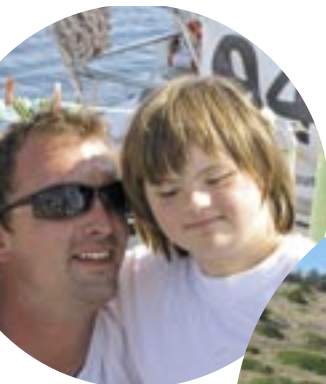
Leja in skiper Mate sta postala velika prijatelja.